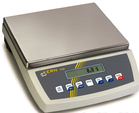
Type FKB en FKB-M