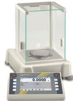
KERN AET [d] = 0,1 mg