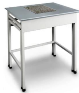
Weegtafel voor stabiele opstelling van analytische balansen