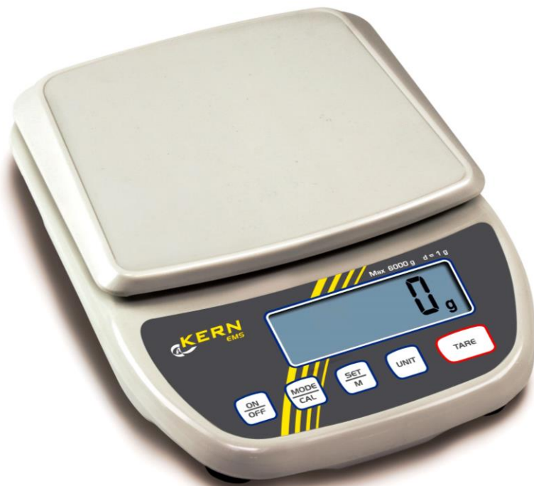
Weegvlak 17,5 x 19 cm, kunststof, type B