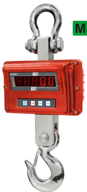
KERN HFO (voor handelsdoeleinden)