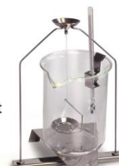
Soortelijk gewicht meet-set